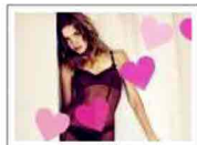
San Valentino 2010: idee by Etam