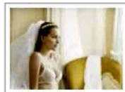
La Perla Bridal