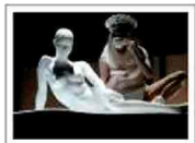
Lady Gaga Amfar