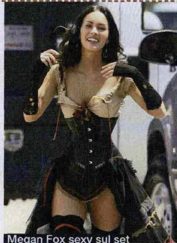
Megan Fox sexy sul set del nuovo film Jonah Hex

Lingerie da star: ammiccante e in stile "bella del saloon". 1. Plumetis e pizzo: in tulle a pois, la guêpière sottolinea le curve (La Redoute, 44,90 euro). 2. Lucido raso: un top elegante, da abbinare a slip e reggicalze (Etam, 50, 20 e 25 euro). 3. Tulle e tessuto opaco: il top ha la scollature a cuore, lo slip una lavorazione a laser (Lovey by Luna, 54 e 19,50 euro). 4. Stecche e nastri: un coordinato da sartoria, in raso (My yoyo, bustier 129 euro, slip 38 euro, reggicalze 69 euro).